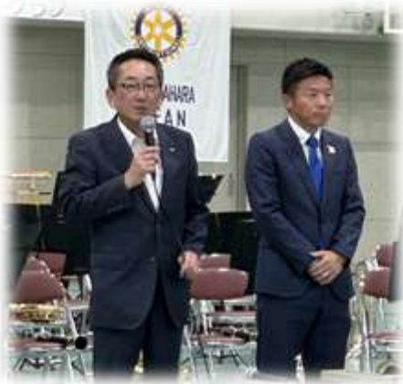
ご挨拶 浅野 健司 市長