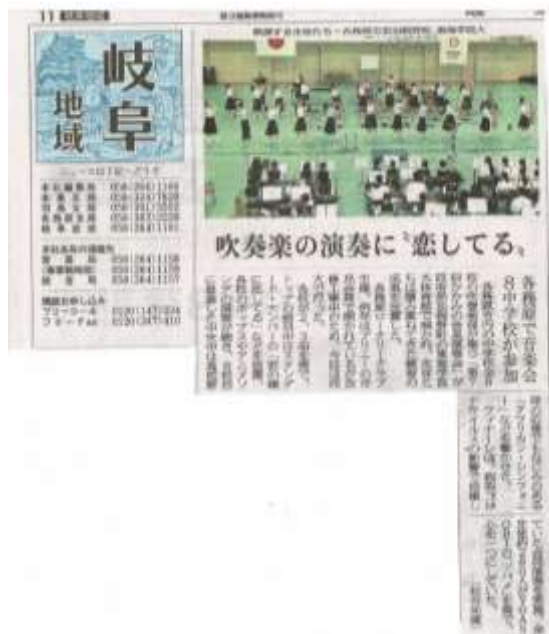
2024. 7. 21 岐阜新聞掲載